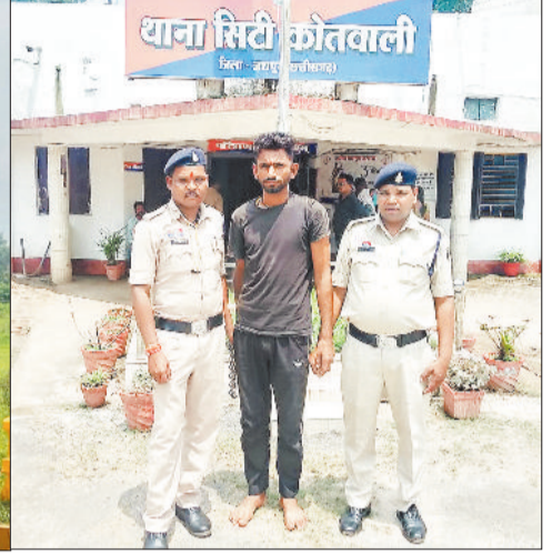
पुलिस गिरफ्त में आरोपी।