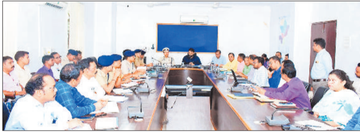
जनपद पंचायत के अधिकारियों की बैठक लेते कलेक्टर।

उन्होंने कुछ क्षेत्रों में पीएम आवास के संबंध में आ रही शिकायतों पर संज्ञान लेते हुए सभी की जांच कर दोषियों के विरुद्ध सख्त कार्रवाई करने के निर्देश दिए। उन्होंने सभी विकासखंडों में अधिकारियों को जियो टैगिंग एवं अन्य जानकारी की जांच कर योजना में किसी भी प्रकार की गड़बड़ी करने वालों पर सख्त कार्रवाई करने के निर्देश दिए। उन्होंने ग्रामीण सचिवों में सभी नोडल अधिकारियों द्वारा किये गए निरीक्षणों की