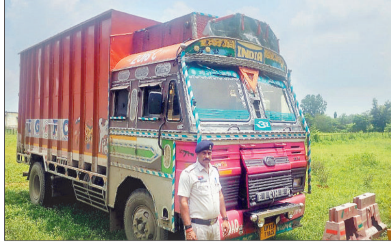
धेराबंदी कर रोके गए ट्रक से बरामद हुई शराब।