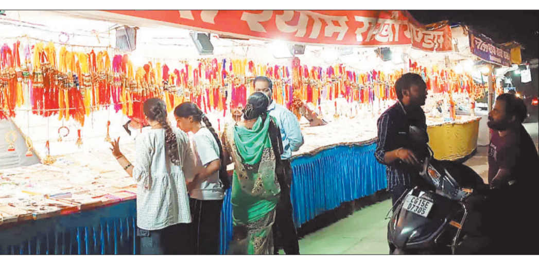
राखी की खरीदारी करते करते लोग।

राखी पर्व को लेकर शहर के स्कूल रोड, देवीगंज रोड, घड़ी चौक, दुर्गा बाड़ी के अलावा मुख्य मार्ग किनारे कई जगह बड़ी संख्या में राखी दुकान लगाई गई है जहाँ बड़ी संख्या में बहनों की भीड़ राखी लेने पहुंच रही है। हालांकि कुछ दिन पूर्व दुकानों में गिने चुने ही ग्राहक आ रहे थे परंतु जैसे ही रक्षा बंधन का त्यौहार नजदीक आ रहा है वैसे ही दुकानों में भीड़ उमड़ने लगी है। इधर भाई की कलाई में कौन सी राखी अच्छी लगेगी इसके लिए बहने काफी समय दुकान में राखियां पसंद करते नजर