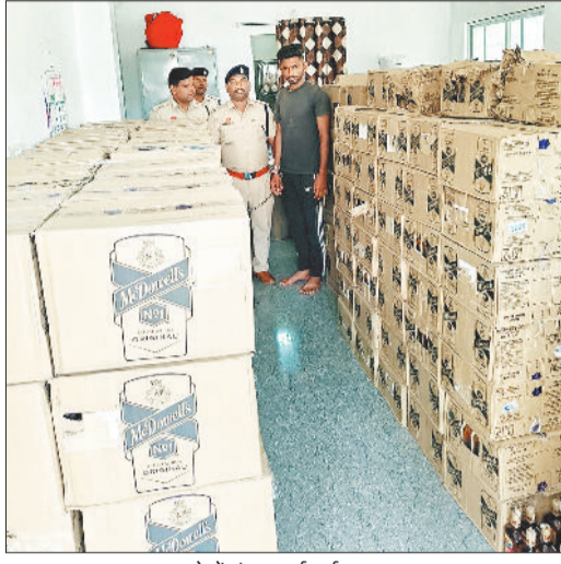
थाने में डंप कराई गई शराब।